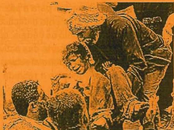
Familiares e veciños evacúan un neno iraquí ferido nun bombardeo aliado.

Esta guerra de EE.UU a Iraque non foi unha decisión que se adoptara no ámbito das Nacións Unidas nin no marco do Dereito Internacional; tampouco é unha guerra en lexítima defensa. Polo contrario, esta guerra é un eslabón máis da política unilateral que está a impor a actual administración norteamericana co apoio, entre outros, do goberno español do Sr. Aznar e o apoio unánime do seu grupo parlamentario. Política unilateral que certamente non foi inventada por esta administración aínda que é ben claro que está a ser relanzada con gran forza desde os atentados do 11-S de 2001. Unilateralismo norteamericano que supón unha forma de encarar a política desde unha perspectiva altamente problemática e conflictiva para a convivencia pacífica entre as nacións. Unilateralismo que leva consigo a recuperación da ideoloxía dual e maniquea da guerra fría, "nós, os bos" fronte o "Imperio do Mal", antes o malvado comunismo agora o islam, o terrorismo musulmán e mesmo o musulmán. Esta simplificación e dualización da sociedade, "os que non están comigo, están contra min", é un esquema coñecido e sufrido en varias partes do mundo, tamén en España, e constitúe un dos peores escenarios aos que se pode chegar para resolver un conflito.